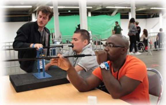
Un projet sportif