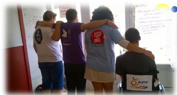
Une rencontre inter-association